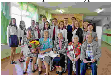
На фото: учащиеся 10 класса на встрече с педагогами

например, «Урок России» для учащихся 8-11 классов, на который были приглашены педагоги-ветераны.